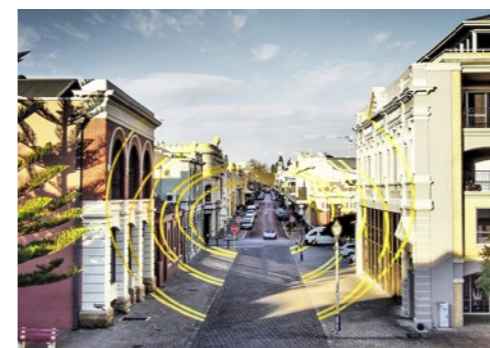
Sehenswert! Aborigines-Statue am Yagan Square. Rooftop-Bar im Boutique-Hotel QT. Street-Art von Künstler Felice Varini im Fremantle-Quartier.