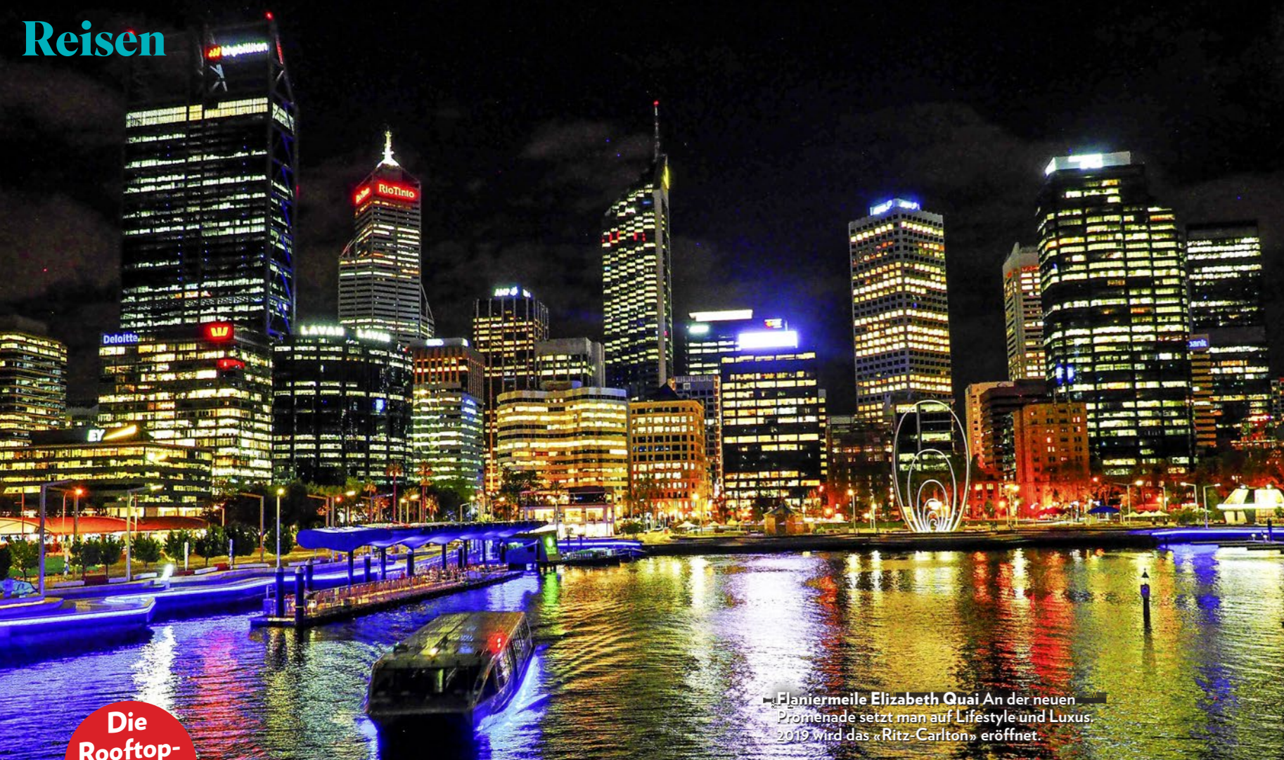
Flaniermeile Elizabeth Quay An der neuen Promenade setzt man auf Lifestyle und Luxus, 2019 wird das «Ritz-Carlton» eröffnet.